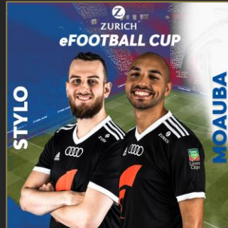
Zurich eFootball Cup 2020