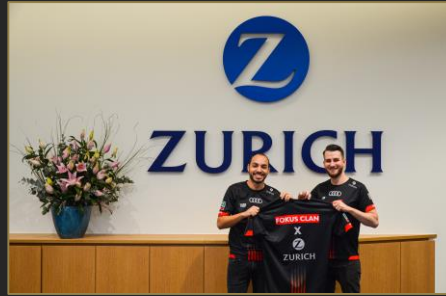
Announcement der Partnerschaft