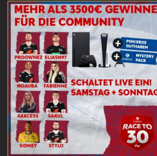
Zurich-Race to 30